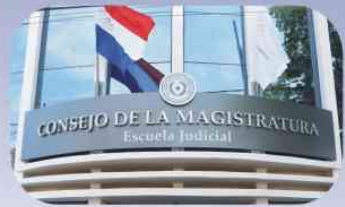
CONSEJO DE LA MAGISTRATURA ESCUELA JUDICIAL